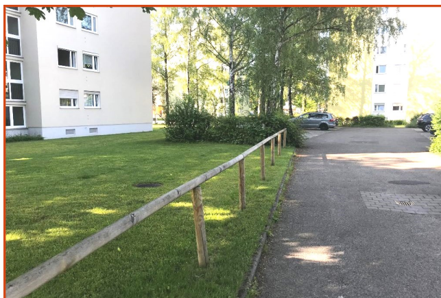
Auf dem städtischen Grundstück in der Richard-Wagner-Straße entstehen weitere Parkplätze

Neben den neu geschaffenen Mitarbeiterparkplätzen am BRK-Seniorenzentrum und den neuen Garagen in der Wohnanlage Richard-Wagner-Straße 13, wird - wie bereits in der letzten Ausgabe unserer Stadtteilzeitung berichtet - die stark belastete Richard-Wagner-Straße weiter entlastet. Östlich unseres Bürgerhauses wird die vorhandene Parkreihe auf dem städtischen Grundstück erweitert. Im Rahmen der Wohnumfeldverbesserung Am Neufeld entstehen ebenfalls neue