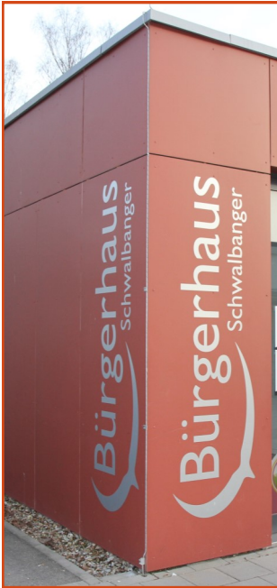
Das Bürgerhaus ist aktuell nur eingeschränkt geöffnet