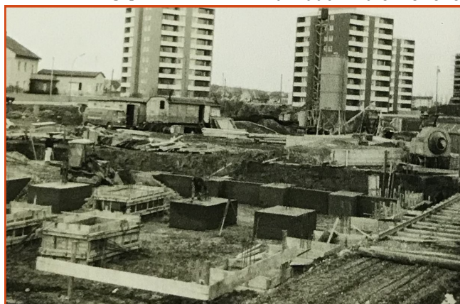
Für die geplante Ausstellung suchen wir Bilder aus vergangenen Tagen, wie z. B. das Foto vom Bau der Grundschule Am Schwalbanger.

Leitung gefunden. Unser Kooperationspartner plant, wie bereits berichtet, den alten Kindergarten St. Peter abzureißen und durch einen viergeschossigen Neubau zu ersetzen. Hier soll das Familienzentrum des St.