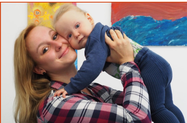
Donnerstag ist JuMaMa Zeit: Unser neues Angebot für junge Mamas.