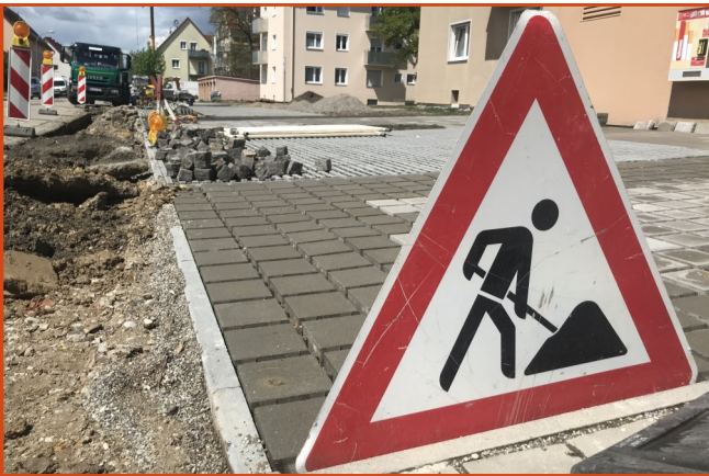
Neue Stellplätze sind nur eines der Sanierungspunkte Am Neufeld

Ebenfalls eine große Bereicherung für unseren Stadtteil wäre der geplante Bewegungspark - ein Ort zur sportlichen Bewegung und des sozialen Miteinanders. Geplant ist, wie bereits in der letzten Stadtteilzeitung groß berichtet, einen Platz zu schaffen, der von allen Stadtteilbewohnern genutzt wird. Mehr dazu auf Seite 7.