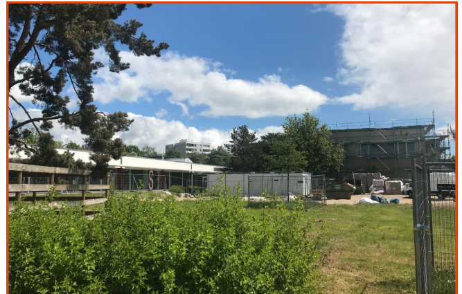
Bereits zum kommenden Schuljahr 2021/22 sollen die Schüler*innen in den neuen Räumlichkeiten unterrichtet werden

Spielplatzaufwertung. Die Stadt Neuburg wertet ihre Spielplätze im Rahmen des Erneuerungsprogramms nach und nach auf. Geplant ist den jeweiligen Spielplätzen Schwerpunkte zu verleihen. Die Aufwertung für den Spielplatz in unserem Stadtteil, genauer gesagt in der Gundelfingen Straße, befindet sich jedoch noch in der Planungsphase. Sie